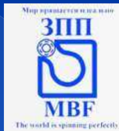
ООО «Завод приборных подшипников»