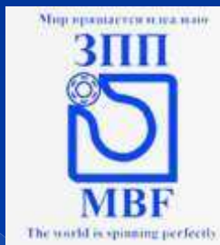
ООО «Завод приборных подшипников»